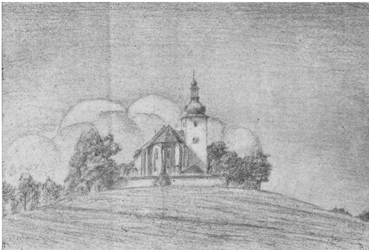
Pepa Bican: Kostelec